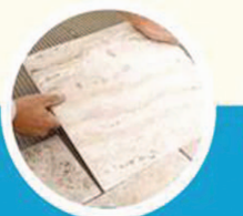
Stone and Tiles Flooring