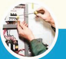
Electric and grinding Work