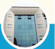
Elevation and Whitewash