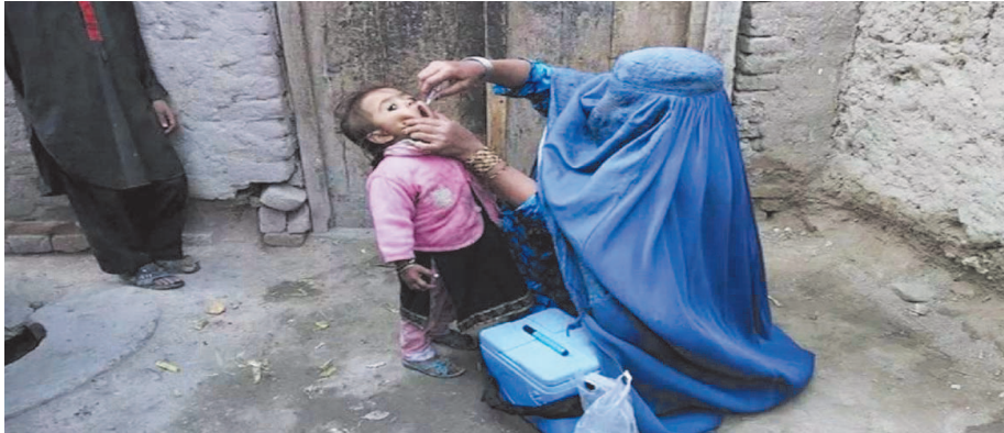
इससे पहले साल 2023 में वाइल्ड पोलियो वायरस के 126 मामले मिले थे। पाकिस्तान के स्वास्थ्य मंत्री नदीम जान ने कहा कि पिछले साल 126 पॉजिटिव नमूनों में से 120 मामलों में

राष्ट्रीय स्वास्थ्य संस्थान के एक अधिकारी के अनुसार, क्रेटा और कराची पूर्व में चार नमूने, पेशावर, कराची दक्षिण, कराची केमारी से दो-दो नमूने। इसके अलावा हैदराबाद, पिशिन, केच, नसीराबाद, डीजी खान, रावलपिंडी और लाहौर से 2 जनवरी से 16 जनवरी के बीच ये नमूने एकत्र किए गए थे। यहां मिले सभी नमूनों में वाइल्ड पोलियो वायरस की पुष्टि हुई है। अधिकारी ने कहा कि जनवरी 2024 में 28 पॉजिटिव केस मिले हैं।