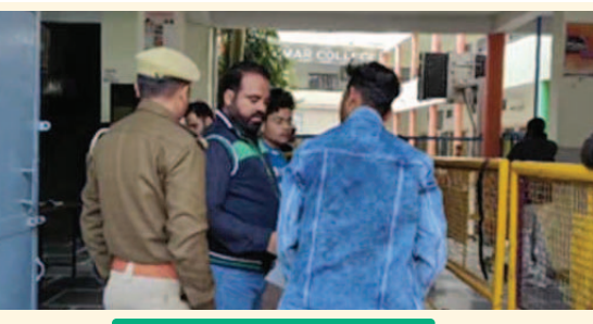
इसको लेकर सभी केंद्रों पर जिला प्रशासन और पुलिस प्रशासन ने शुचितापूर्ण तरीके से नकलविहीन परीक्षा सुनिश्चित करने के लिए कड़े सुरक्षा इंतजाम किये गये हैं। सभी परीक्षा केंद्रों पर रिपोर्टिंग टाइम साढ़े नौ बजे का रहा और इसके बाद अभ्यर्थियों को परीक्षा केंद्र में प्रवेश रोक दिया गया। जो छात्र परीक्षा केंद्रों में भीतर पहुंचे उनकी त्रिस्तरीय चेकिंग

झांसी। उत्तर प्रदेश पुलिस भर्ती बोर्ड द्वारा आयोजित पुलिस भर्ती परीक्षा 2024 शनिवार को पुलिस और प्रशासन के कड़े इंतजामों के बीच शुरू हो गयी। झांसी जिले में आज प्रथम पाली में लगभग 22 हजार अभ्यर्थी 47 परीक्षा केंद्रों पर परीक्षा देंगे और दो दिनों तक चलने वाली इस परीक्षा में लगभग 85 हजार अभ्यर्थी परीक्षा देंगे। इसके लेकर सभी केंद्रों पर जिला प्रशासन और पुलिस प्रशासन ने शुचितापूर्ण तरीके से नकलविहीन परीक्षा सुनिश्चित करने के लिए कड़े सुरक्षा इंतजाम किये गये हैं। सभी परीक्षा केंद्रों पर रिपोर्टिंग टाइम साढ़े नौ बजे का रहा और इसके बाद अभ्यर्थियों को परीक्षा केंद्र में प्रवेश रोक दिया गया। जो छात्र परीक्षा केंद्रों में भीतर पहुंचे उनकी त्रिस्तरीय चेकिंग