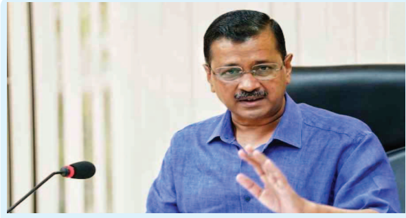
दिल्ली के मुख्यमंत्री अरविंद केजरीवाल आज शराब नीति मामले में उनके खिलाफ प्रवर्तन निदेशालय की हालिया शिकायत के मामले में वीडियो कॉन्फ्रेंसिंग के जरिए राउज एवेन्यू कोर्ट में पेश हुए।

दिल्ली के मुख्यमंत्री अरविंद केजरीवाल आज शराब नीति मामले में उनके खिलाफ प्रवर्तन निदेशालय की हालिया शिकायत के मामले में वीडियो कॉन्फ्रेंसिंग के जरिए राउज एवेन्यू कोर्ट में पेश हुए। मुख्यमंत्री ने कोर्ट को बताया कि विधानसभा में विश्वास प्रस्ताव पर चर्चा और चालू बजट सत्र के कारण वे आज अदालत में वे शारीरिक रूप से उपस्थित नहीं हो सके। कोर्ट ने अरविंद केजरीवाल को पेशी के लिए 16 मार्च की तारीख तय की है। दिल्ली के मुख्यमंत्री अरविंद