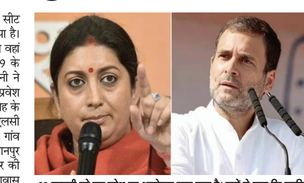
22 फरवरी को गृह प्रवेश का आयोजन रखा गया है। सूत्रों ने कहा कि स्मृति ईरानी ने समारोह के लिए पार्टी लाइन से ऊपर उठकर स्थानीय विधायकों और एमएलसी सहित लगभग 25,000 लोगों को निमंत्रण भेजा है।

नई दिल्ली। कांग्रेस नेता सोनिया गांधी ने अपनी संसदीय सीट रायबरेली की रस से औपचारिक रूप से खुद को अलग कर लिया है। वहीं अमेठी सीटल से भाजपा सांसद और केंद्रीय मंत्री स्मृति ईरानी वहां स्थानीय निवासी के रूप में बसने की तैयारी कर रही हैं। 2019 के लोकसभा चुनाव में कांग्रेस के राहुल गांधी को हराने वाली ईरानी ने गौरगंज में अपने लिए एक घर बनवाया है। 22 फरवरी को गृह प्रवेश का आयोजन रखा गया है। सूत्रों ने कहा कि स्मृति ईरानी ने समारोह के लिए पार्टी लाइन से ऊपर उठकर स्थानीय विधायकों और एमएलसी सहित लगभग 25,000 लोगों को निमंत्रण भेजा है। मेदान मर्वई गांव में लगभग 15,000 वर्ग फुट के क्षेत्र में बना विशाल घर सुल्तानपुर रोड स्थित स्थानीय भाजपा कार्यालय से बमुश्किल 2 किलोमीटर की दूरी पर स्थित है। पिछले साल जनवरी में स्मृति ईरानी ने अपने आवास पर खिचड़ी भोज का आयोजन किया था। इसे एक ऐसा समारोह बताया जा जिसका राजनीति से कोई लेना-देना नहीं था। उस कार्यक्रम में गायत्री प्रजापति की पत्नी और अमेठी विधायक महाराजी प्रजापति सहित विपक्षी विधायकों ने भाग लिया था। भाजपा के अमेठी प्रवक्ता गोविंद चौहान ने कहा, स्मृति ईरानी ने