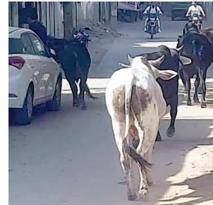
आवारा पशु झुंड बनाकर घूमते हैं और वहाँ से निकलने वाले लोगों को अपना शिकार बना लेते हैं।

फरीदाबाद की आवाज फरीदाबाद। जिले में आवारा पशुओं का आतंक लगातार बढ़ता जा रहा है। नगर निगम प्रशासन की लापरवाही के चलते आवारा पशु लोगों की जान के लिए खतरा बने हुए हैं। इसी कड़ी में आवारा पशु ने एक महिला को टक्कर मार दी, जिससे महिला बुरी तरह जखमी हो गई, फिलहाल महिला का इलाज फरीदाबाद सिविल अस्पताल में जारी है। फरीदाबाद की डबुआ मंडी में महिला सब्जी लेने गई थी, जहाँ आवारा सांड ने महिला को टक्कर मार दी, जिसकी वजह से महिला बुरी तरह जखमी हो गई। महिला के पति की माने तो उसकी पत्नी डबुआ मंडी में सब्जी लेने गई थी जहाँ पर काफी आवारा पशु घूम रहे थे। उनमें से एक सांड ने उसकी पत्नी को टक्कर मारकर बुरी तरह जखमी कर दिया। फरीदाबाद की सड़कों पर