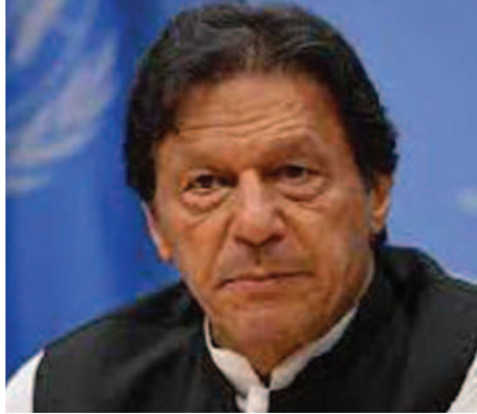
अफरातफरी घातक सिद्ध होगी और यह देश के लिए अच्छा नहीं होगा। अपने समय महान क्रिकेटर रहे इमरान खान और उनकी पाकिस्तान तहरीक-ए-इंसाफ (पीटीआई) पार्टी अप्रैल में अविश्वास प्रस्ताव में प्रधानमंत्री पद से हटाए जाने के बाद से सरकार पर जल्दी चुनाव कराने के लिए जोर देने के लिए देशव्यापी विरोध प्रदर्शन कर रही है।

उन्होंने अपने समर्थकों से भावनात्मक अपील करते हुये कहा कि देश पहले ही आर्थिक संकट का सामना कर रहा है लिहाजा देश में किसी तरह