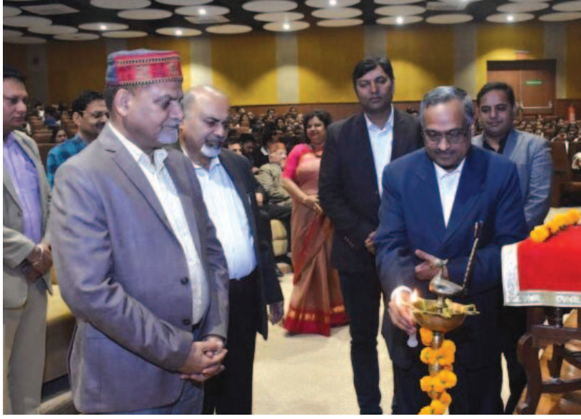
योगदान में एक निर्णायक कारक रहा है। उन्होंने कहा कि अक्सर हमेशा चुनौतियों को कमजोर