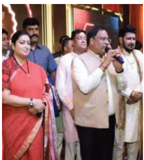
5 दिवसीय गणेश महोत्सव सम्पन्न