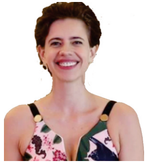
कल्क को मिला नया प्यार

वर्ष: 02 अंक: 41 दिल्ली से प्रकाशित सोमवार 09 सितम्बर - 15 सितम्बर 2019 मूल्य: 5/- रु. पृष्ठ: 8